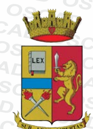
Polizia di Stato