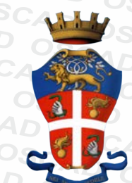
Arma dei Carabinieri