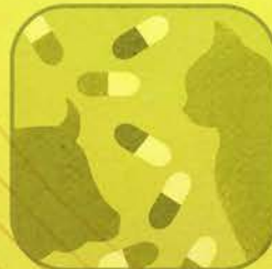
Farmaci per Animali