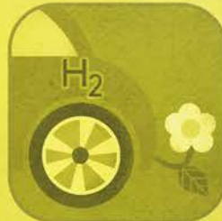
Auto a Idrogeno