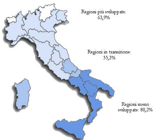
Figura 1 - Distribuzione del tasso di adesione per categoria di regioni

All'Avviso pubblico Prot. 9035 del 13/07/15 rivolto alle Istituzioni scolastiche statali per la realizzazione, l'ampliamento o l'adeguamento delle infrastrutture di rete LAN/WLAN - Fondi Strutturali Europei – Programma Operativo Nazionale "Per la scuola – Competenze e ambienti per l'apprendimento" 2014-2020. - Asse II Infrastrutture per l'istruzione – Fondo Europeo di Sviluppo Regionale (FESR) - Obiettivo specifico – 10.8 – "Diffusione della società della conoscenza nel mondo della scuola e della formazione e adozione di approcci didattici innovativi" – Azione 10.8.1 Interventi infrastrutturali per l'innovazione tecnologica, laboratori di settore e per l'apprendimento delle competenze chiave hanno aderito, inoltrando la propria candidatura, 6.108 1 scuole su un totale di 8.847 possibili beneficiari. Il tasso di adesione complessivo è del 69% e varia per area geografica, come mostrato dalla figura 1.