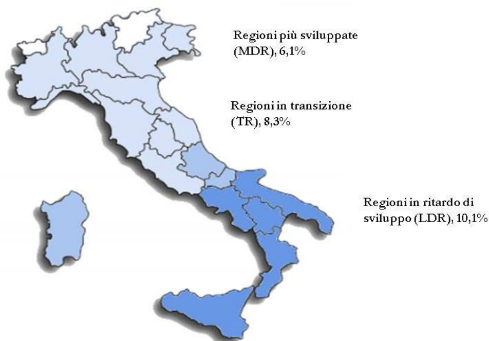
Fig. 1 – Tasso di adesione per area territoriale

Di seguito mostriamo il dettaglio della distribuzione delle istituzioni scolastiche con candidatura inoltrata per Area territoriale e regione.