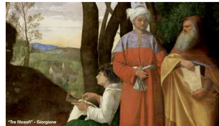
"Tre filosofi" - Giorgione

In collaborazione col Master "Storia e Cultura dell'Alimentazione" Centro di Storia dell'Alimentazione - Università di Bologna